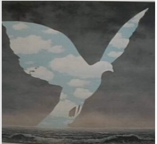
Dipinto: " La grande famiglia " di: Magritte

( ..... lui cominciava a raccontarmi cose di anni molto lontani, quando si viveva tutti insieme, e io e le mie sorelle eravamo ancora ragazzi. )